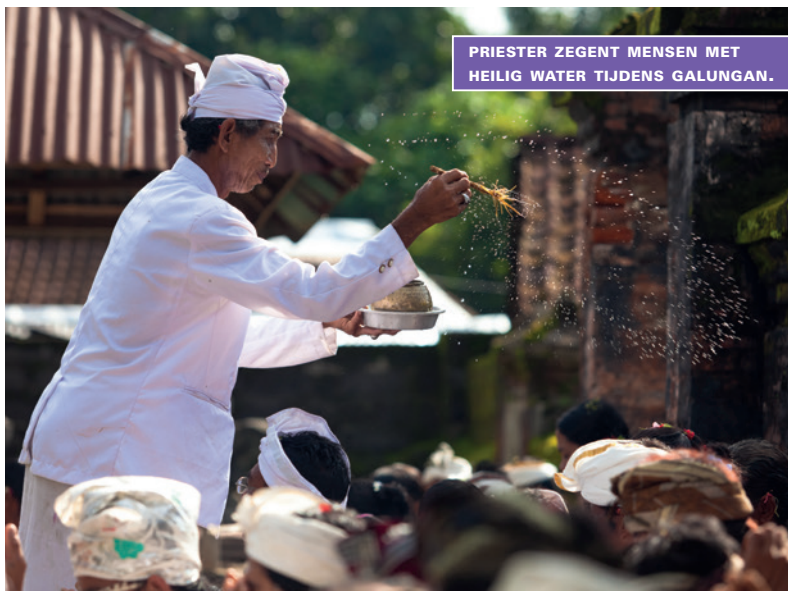
PRIESTER ZEGENT MENSEN MET HEILIG WATER TIJDENS GALUNGAN.

Om de 210 dagen is het Galungan , een belangrijk feest op de Balinese kalender, dat drie dagen duurt. Bij die gelegenheid keert iedereen naar zijn geboortedorp terug om de goden en voorouders te eren, die volgens het plaatselijke geloof afdalen in de tempels. Tien dagen later is het Kuningan , dat een dag lang gevierd wordt. Tijdens deze periode